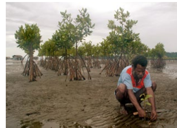
Durante um projeto de desenvolvimento baseado na língua materna, o povo da vila chamada Ambai em Papua, Indonésia, aprendeu que o desmatamento dos mangues provocou erosão do solo.

Os princípios de preservação do meio ambiente são comunicados entre as línguas através de programas de desenvolvimento do potencial linguístico e da produção de literatura. O desmatamento é um problema crítico em todo o mundo. Quando as populações locais aprendem a tecnologia apropriada, que, somada ao conhecimento tradicional sobre a flora e fauna, são supridas suas necessidades econômicas e ao mesmo tempo o meio ambiente é protegido.