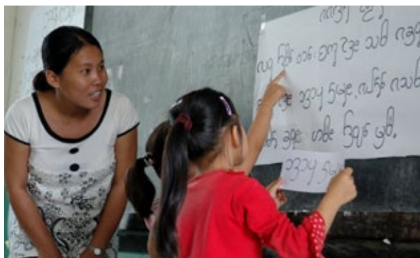
A alfabetização ocorre com mais facilidade quando se utiliza a língua que o aluno fala melhor.

Os programas de ensino fundamental que começam na língua materna ajudam os alunos a desenvolverem habilidades de alfabetização e habilidades numéricas mais rapidamente. Quando ensinados em sua língua local, os alunos transferem as habilidades de alfabetização com facilidade para as línguas oficiais utilizadas no sistema de educação, adquirindo ferramentas essenciais para a aprendizagem por toda a vida. Os resultados são um aumento da auto-estima e uma comunidade melhor equipada para ser alfabetizada nas línguas de comunicação mais ampla.