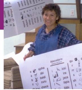
Les élèves comprennent les concepts de lecture grâce à l'alphabet quechua et des tableaux de mots, même quand ceux-ci sont employés dans des classes où l'espagnol est la langue d'enseignement.

Le travail de Langue et Développement consiste en une série d'actions durables planifiées, entreprises par une ethnie pour s'assurer que sa langue continue de répondre à ses besoins sociaux, culturels, politiques, économiques et spirituels en évolution ainsi qu'à ses objectifs dans ces domaines.