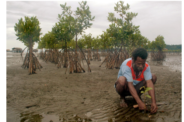
Pendant un programme de Langue maternelle et Développement, les habitants d'un village ambai en Papouasie indonésienne ont appris que l'érosion du sol était due à la destruction de la mangrove.

Dans les programmes de Langue et Développement, des ouvrages informent des principes de protection de la nature. Quand la population locale apprend des techniques adaptées tout en gardant sa connaissance traditionnelle de la flore et de la faune, elle répond à ses besoins économiques tout en préservant l'environnement.