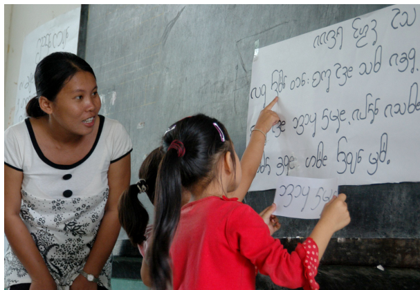
On apprend plus facilement à lire dans la langue que l'on parle le mieux.

Quand les élèves débutent l'école primaire dans leur langue maternelle, ils apprennent plus rapidement à lire, écrire et compter. Ils transfèrent ensuite facilement les compétences de lecture et d'écriture acquises dans leur langue dans la langue officielle de l'enseignement, ayant ainsi des outils essentiels pour continuer d'apprendre leur vie durant. Il en résulte qu'ils ont une meilleure image d'eux-mêmes et que leur ethnie est mieux préparée à savoir lire et écrire dans une langue de grande diffusion.